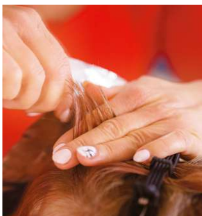
Neue Abstands- und Hygieneregeln gelten im Friseurhandwerk. Daher sind Friseure angehalten neu zu kalkulieren.

Um sich im wirtschaftlichen Wettbewerb behaupten zu können, ist eine fundierte Kalkulation eine unabdingbare Voraussetzung. In Corona-Zeiten gilt es für Handwerker die Kalkulation nachzuschärfen. Denn Hygiene- und Abstandsregeln können zu erheblichen Mehraufwänden für die Firmen führen, die berücksichtigt werden müssen. Ein Interview mit Claudia Rommel, Abteilungsleiterin Beratung der Handwerkskammer Dresden.