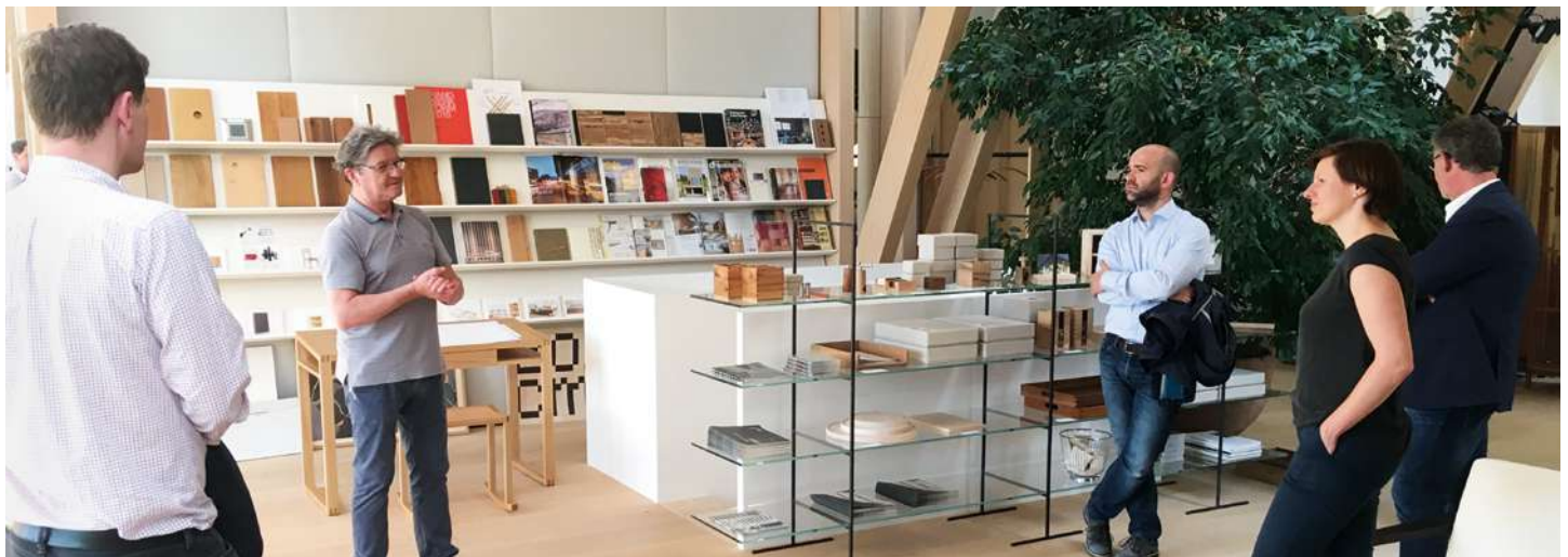
Besuch im Werkraum Bregenzwald. Hier kommen Handwerker seit 2013 regelmäßig zum Kreativ-Dialog zusammen und haben seither viel erreicht.