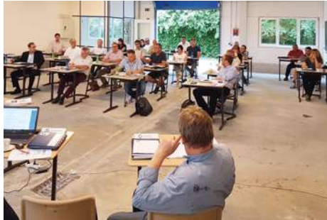
Erstmals in der Offenen Werkstatt in Riesa fand die Tagung coronabedingt mit Abstand statt

Der Kreishandwerksmeister berichtete über die Ergebnisse der Gesprächsrunde zum „Dialogprozess zur Berufsschulnetzplanung“, zu welchem die Handwerkskammer Dresden am 26. Mai 2020 eingeladen hatte. Diese Zusammenkunft war wie befürchtet lediglich der Versuch von Besitzstandswahrung der einzelnen Gewerke. Bedauerlicherweise wird in der weiteren Diskussion aus seiner Sicht zu wenig auf die Qualität der Ausbildung geschaut. Beispielsweise ist die Qualität der Ausbildung auch abhängig von der Anzahl der Auszubildenden. Bei einer Zweizügigkeit von Fachklassen kann beispielsweise der krankheitsbedingte Ausfall von Fachlehrern besser kompensiert werden. Die Standortfrage der Bäcker Ausbildung habe er nicht kommentiert, weil er der Meinung war, dass die Planungen des zukünftigen Standortes Bautzen vorsehen werden. Die jetzt gefundene Lösung ist ein Kompromiss, um den Standort Dresden zu erhalten. Hier wird insbesondere der Konflikt zwischen Stadt und Land deutlich. Es wird von den Dresdner Handwerkskollegen oft argumentiert, dass es einem 16-jährigen Dresdener Lehrling nicht zuzumuten wäre, ins Umland zu fahren. Umgekehrt wird vorausgesetzt, dass jeder Azubi aus dem Umland in die Landeshauptstadt zu kommen hat. Ich glaube, wir unterschätzen hier die Flexibilität unserer