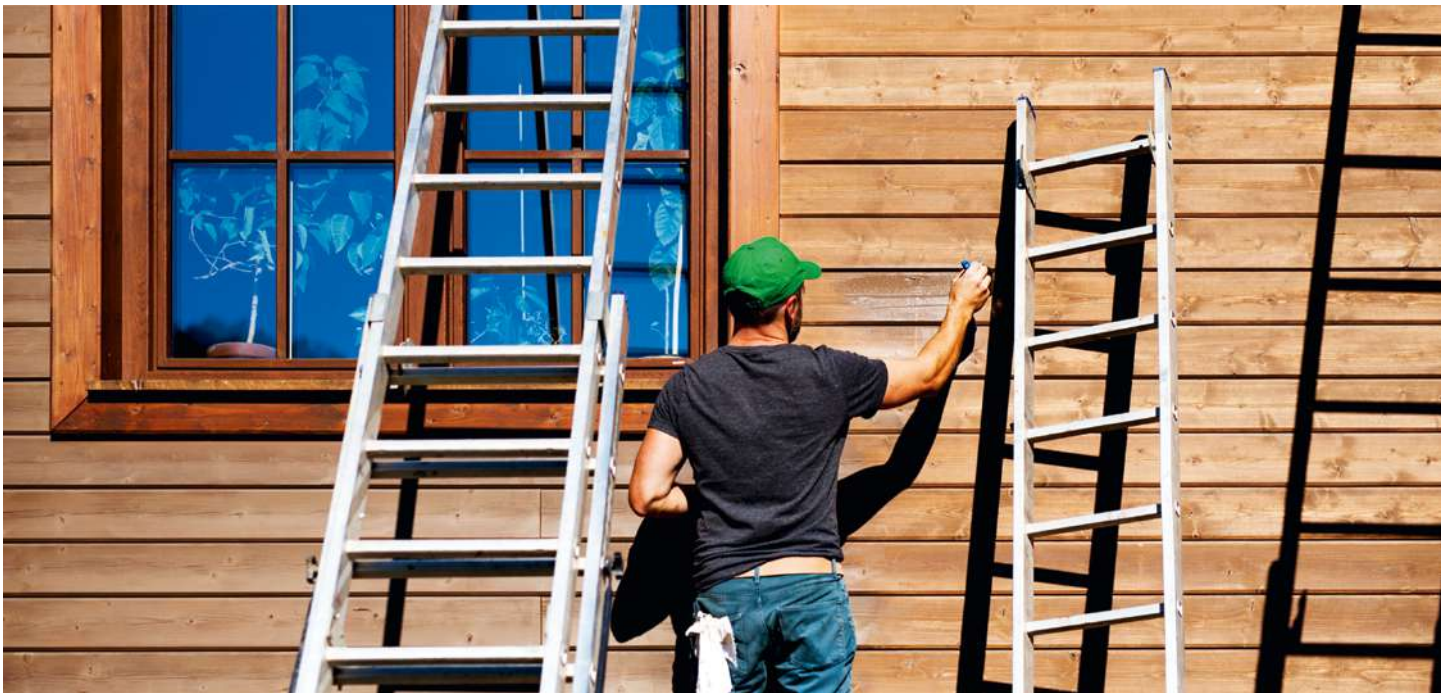
In mittlerweile 16 JugendBauhütten arbeiten und lernen Jugendliche für den Erhalt des kulturellen Erbes