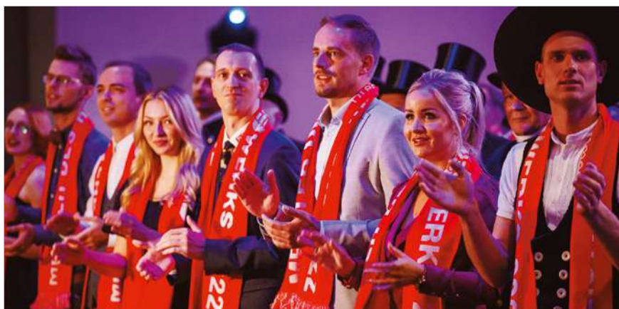
Ein Grund zur Freude: Ab diesem Jahr erhalten Meisterabsolventen in Sachsen einen Meisterbonus in Höhe von 2.000 Euro – damit hat sich der Betrag verdoppelt.

Jetzt informieren und jederzeit starten! kundenberatung@njumii.de 0351 4640-100