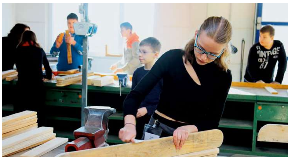
„Bau Deinen eigenen Schwedenstuhl“ – Feriencamp in den Winterferien

rungsgeschäfte auf Bundesebene durch die Jamaika-Koalition kein beschlossener Bundeshaushalt vorlag, gab es seitens des zuständigen Bundesministeriums für Bildung und Forschung auch keine Freigabe der Fördermittel. Erst zum 1. September 2022 lag bei der Kreishandwerkerschaft der Fördermittelbescheid für die 15-monatige Projektphase vor. Das Rittergut ist dabei zentraler Ansatzpunkt in der ersten Projektphase bis November 2023. Zunächst fand eine Objekt- und Potenzialanalyse statt. Daraus ließen sich erste Ansätze ableiten, mit welchen Gewerken eine tiefergehende Betrachtung gegeben ist. In zwei Veranstaltungen konnten die Handlungsziele vorgestellt sowie erste vertiefende Gespräche mit beteiligten Akteuren, wie Handwerkern und Institutionen, durchgeführt werden.