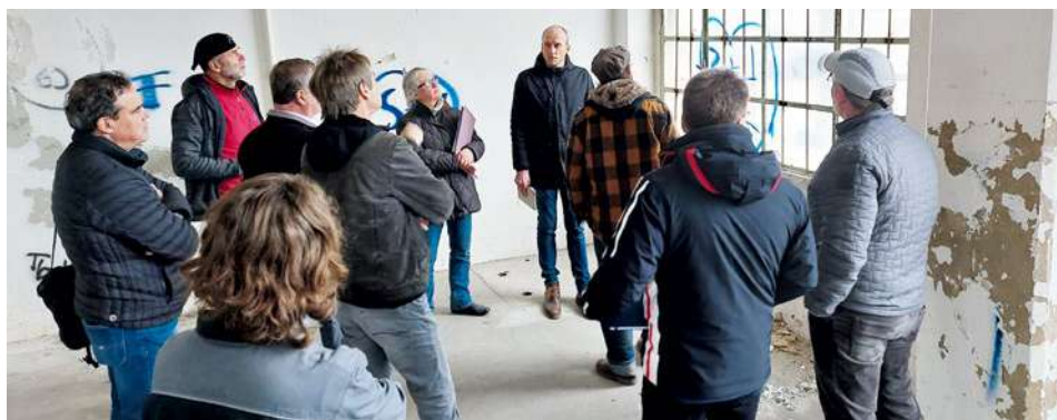
Vertreter der Innung des Maler- und Lackierhandwerks Meißen kamen mit den Projektakteuren der Kreishandwerkerschaft und der Technischen Universität Dresden zu einem fachlichen Austausch am 20. März 2023 in Rittergut zusammen