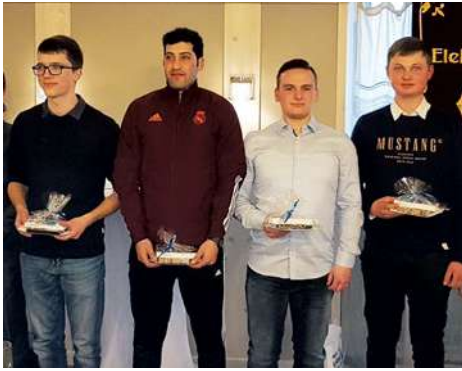
Die vier besten Gesellen

wurden das letzte Mal in diesem feierlichen Rahmen Gesellenbriefe und Zeugnisse überreicht. Neben zwölf Elektronikern für Energie- und Gebäudetechnik und sieben Gesellen aus dem SHK-Gewerk waren zahlreiche Gäste erschienen. So erwiesen den Junggesellen Vertreter der Ausbildungsbetriebe, Berufsschulen und Prüfungsausschüsse ebenso wie der HWK Dresden, IKK classic, Signal Iduna sowie der KHS Region Meißen und Innungen die Ehre.